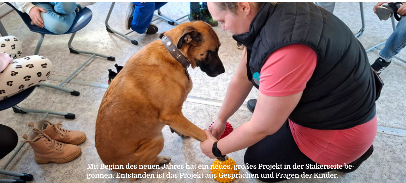
Mit Beginn des neuen Jahres hat ein neues, großes Projekt in der Stakerseite begonnen. Entstanden ist das Projekt aus Gesprächen und Fragen der Kinder.

W as will ich später mal werden? Und was machen die Leute eigentlich den ganzen Tag bei der Arbeit?“ – genau solche Fragen schwirrten den Kindern der OGS Stakerseite durch den Kopf. Für uns war sofort klar, da wollen wir ein Projekt draus machen und unsren traditionellen Projektmittwoch mit einem neuen Highlight bereichern. Nach einem ausführlichen Brainstorming stand fest: Am besten holen wir uns die Infos aus erster Hand – direkt von den Eltern, die mitten im Berufsleben stehen!